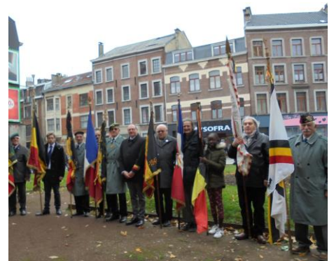
Nos fidèles Porte-drapeaux

D'autres cérémonies de l'Armistice se sont déroulées également au même moment, à Theux, à la Reid, ainsi qu'à Stembert, dont la section de la FNC de Stembert fêtait aussi ses cent ans.