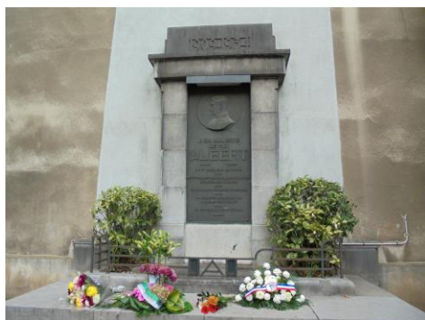
Photos : Monument Albert 1er

J'en appelle aux politiciens pensez à rassembler plutôt qu'à diviser... On ne peut diviser et être sage en même temps, bannissez la médiocrité, pour laisser la place à la sagesse.